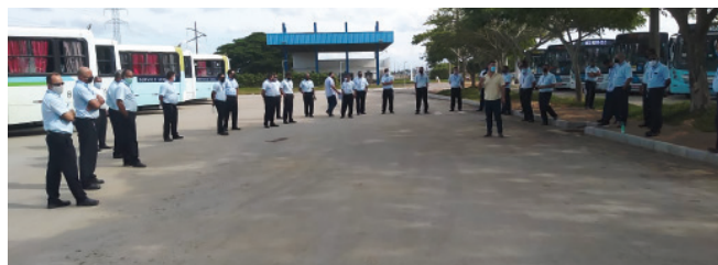
DSS realizada no pátio da WEG na filial da Unimar, em Linhares.

Ao longo do mês os motoristas instrutores desenvolveram e compartilharam material de campanha com foco em regras de