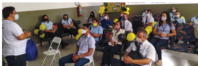
Ações de conscientização da Campanha Maio Amarelo realizadas na garagem da Unimar.