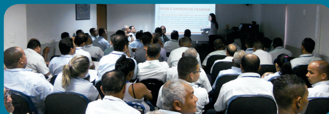
Cerca de 1.200 profissionais participaram da capacitação

Libras - Como forma de alcançar todo o seu quadro funcional, a Unimar contratou um intérprete de libras para traduzir o treinamento aos deficientes auditivos que compõem o quadro de colaboradores, democratizando o acesso às orientações.