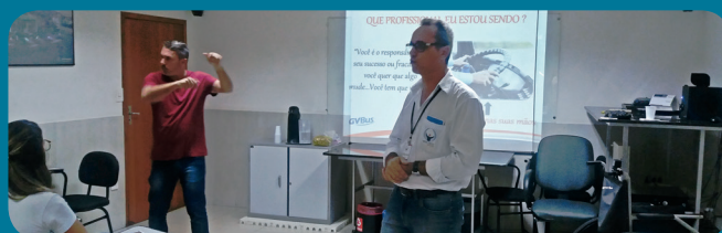
O treinamento foi traduzido em libras