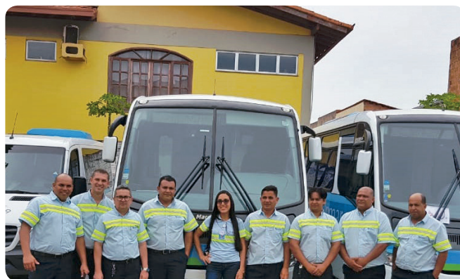
Profissionais que atuam no contrato Órica Brasil

Essas conquistas mostram que a empresa está crescendo no Espírito Santo e em âmbito nacional, abrindo um novo campo para ampliar as suas atividades também em outros estados.