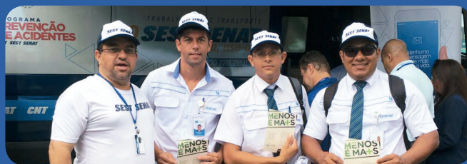
Campanha “Carnaval Seguro” realizada próximo ao Carnaval