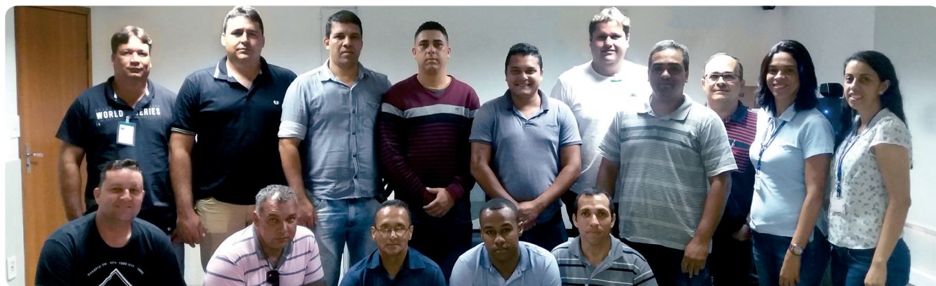
Novos motoristas do contrato Vale Ferrovia durante integração