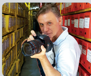
Pequena bailarina