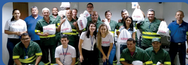
Palestra sobre segurança e alimentação saudável, em abril

As ações incluíram mobilizações socioeducativas, distribuição de materiais da campanha e brindes. Também foram realizadas palestras sobre: direção preventiva, trânsito seguro, álcool e direção, bom senso no trânsito e cuidados com a alimentação.