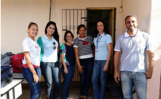
Unimar realizou entrega de peças de roupas no Projeto Mão Estendida

C om a colaboração de todos, a Unimar, mais uma vez, aqueceu o inverno das pessoas atendidas pelo Projeto Mão Estendida, em Colina de Laranjeiras, e pelo Centro