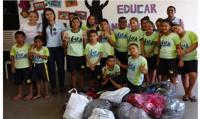
Criançada reunida na entrega das doações no Projeto São José de Calazans

Social São José de Calazans, em Vila Nova de Colares. Na campanha de agasalhos 2018, foram doadas 332 peças entre roupas, calçados e acessórios. Obrigado a todos que participaram!