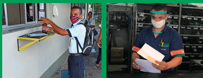
Unimar implantou medidas de prevenção ao coronavírus, como uso de máscaras e de álcool 70%, bem como o distanciamento entre colaboradores