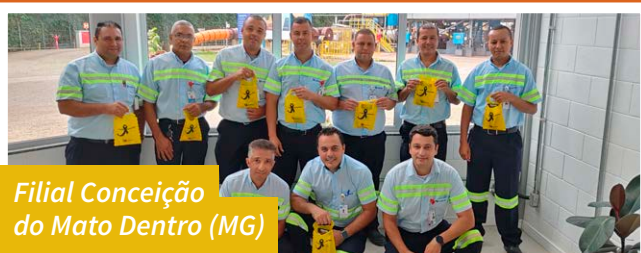
Filial Conceição do Mato Dentro (MG)